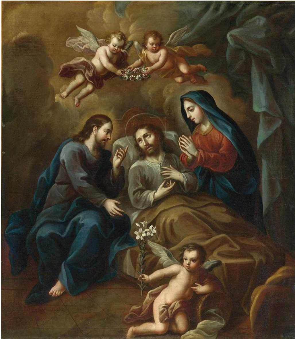
Helige Josefs Saliga Död