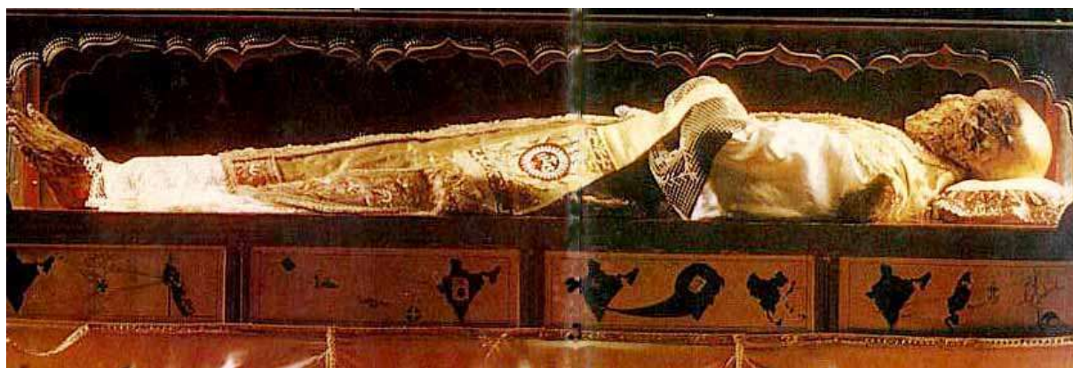
Den Helige Franciskus Xaviers relikier i Goa, Indien

Helige Ärkeängel Mikael, du mäktige försvarare av dem som ber om din hjälp, beskydda mig mot Satans anfall varje ögonblick i mitt liv och framför allt när den Enväldige Domaren kallar mig inför sin Domstol för att avlägga räkenskap för mina gärningar och för min trohet i att uppfylla Guds Heliga Lag. Amen.